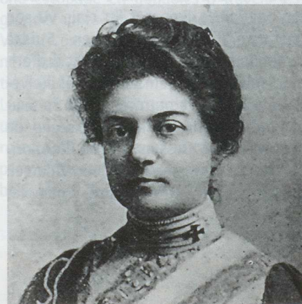
Anita Newcomb McGee