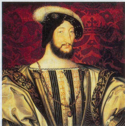
François I er